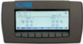
Halbgrafisches Benutzerterminal mit Multifunktionstasten und dynamischen Anzeigesymbolen