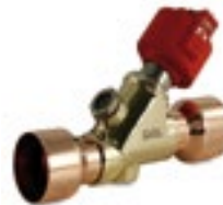
Elektronische Expansionsventile zur Leistungssteigerung.