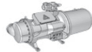
Hocheffiziente Schraubenverdichter mit stufenloser Regelung, optimiert für Kältemittel R134a.