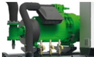
Hocheffiziente Schraubenverdichter, optimiert für Kältemittel R513A.