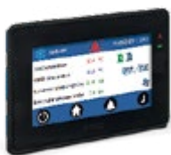
Touchscreen Display der neuesten Generation