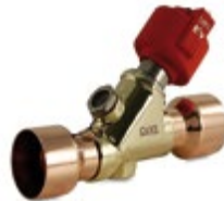
Elektronische Expansionsventile zur Leistungssteigerung.