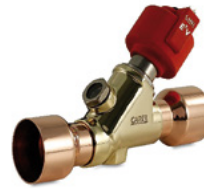
Elektronische Expansionsventile zur Leistungssteigerung.