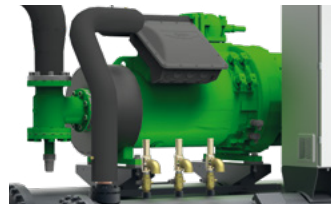
Hocheffiziente Schraubenverdichter, optimiert für Kältemittel R513A.