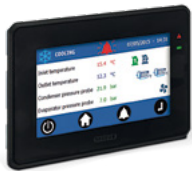
Touchscreen Display der neuesten Generation.